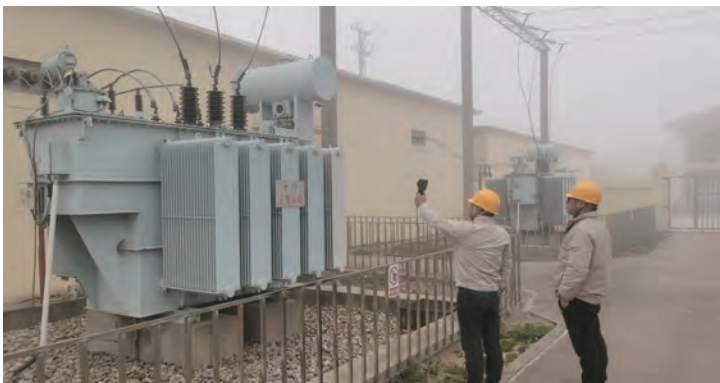
3月12日清晨7点,在大雾的笼罩下,灌西供电所工作人员正在对变电站内高压设备进行巡视、测温。这是该所针对连日出现的大雾天气开展特巡,预防污闪事故的一幕。(匡健)

强化基础提升,筑牢安全责任网。落实安全生产责任,强化安全生产的监管力度,全面覆盖外协单位资质审查、安全告知、协议签订及隐患排查;制定年度安全费用使用计划,遵循新安法及公司管理制度,确保安全生产资金的合理投入,保障隐患整改、安全培训、劳动保护装备、安全技术措施以及相关费用的及时、准确和有效执行;加强与市、区应急部门沟通协调,做好重大危险源核销、项目推进、信息报送等工作。(张昕)